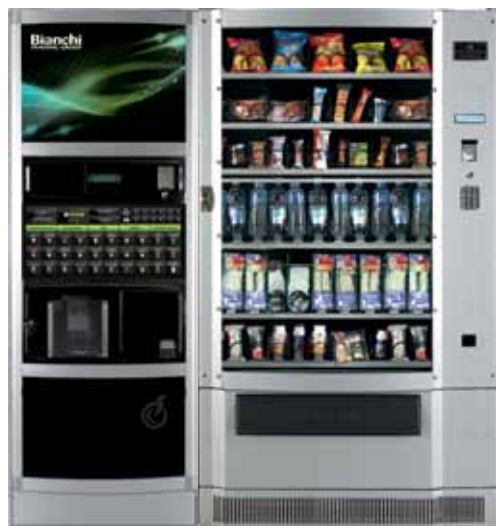
LEI 700 + BVM 695 3°