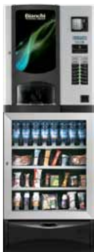
BVM 931 + VISTA S