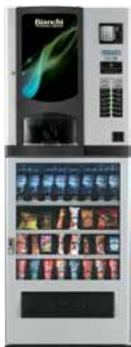
BVM 931 + BVM 636