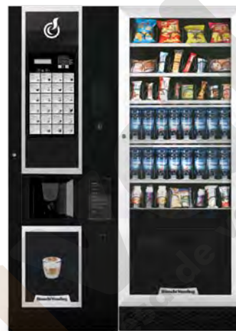
LEI600 SMART + ARIA L SLAVE