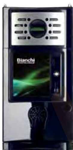
GAIA CON PANEL FRONTAL PER UN VALIDATOR