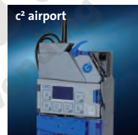
Lectura de los datos

Con currenza airport Usted tiene el control sobre el sistema de pago y de la máquina desde cualquier sitio y a cualquier hora.